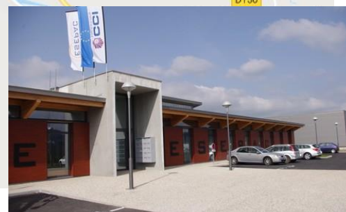
Localisation de l'Ecole Supérieure Européenne de Packaging