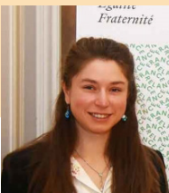
Raphaëlle KOROTCHANSKY Sous-préfète de la Haute-Loire