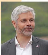
Laurent WAUQUIEZ Président de la Région Auvergne Rhône Alpes