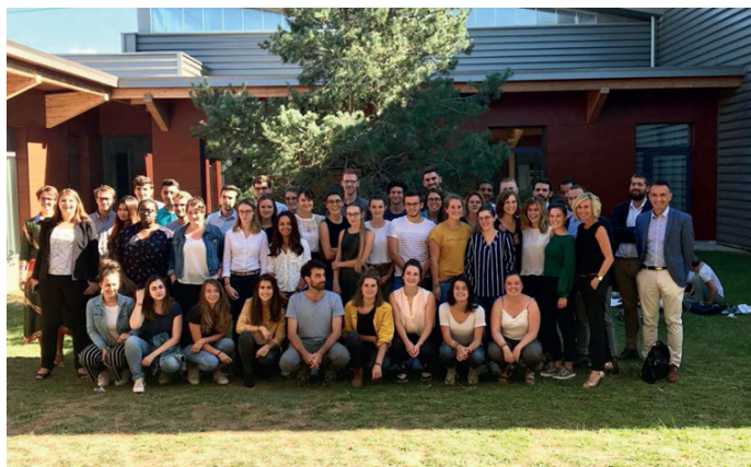
PROMOTION PIERRE FABRE 2018-2020

L'histoire, c'est avant tout une aventure humaine et nous en avons la preuve avec les témoignages des parrains de promotion. Nous sommes ravis que nos promotions depuis 2019 puissent être parrainées par des entreprises et plus particulièrement des personnes investies dans la formation de nos jeunes.