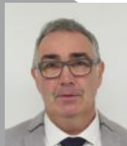
Franck PAILLON Maire de Blavozy