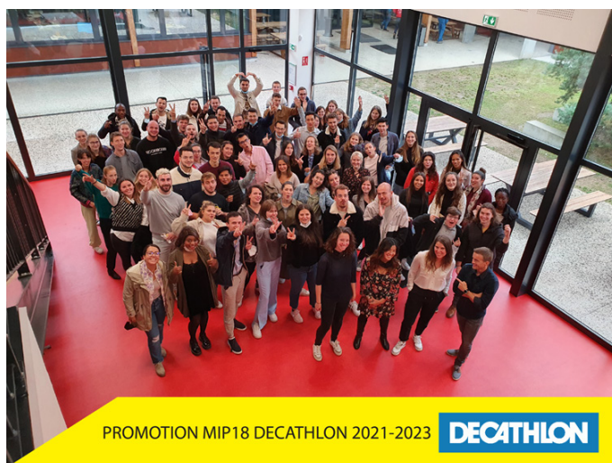
PROMOTION MIP18 DECATHLON 2021-2023 DECATHLON