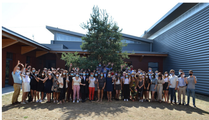
PROMOTION MIP17 CHRISTIAN DIOR 2020-2022